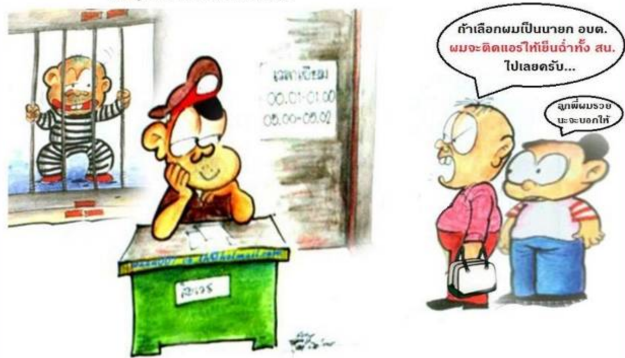
ฝ่าฝืนมีโทษจำคุกตั้งแต่ 1-10 ปี และปรับตั้งแต่ 20,000-200,000 บาท และเพิกถอนสิทธิเลือกตั้ง 10 ปี