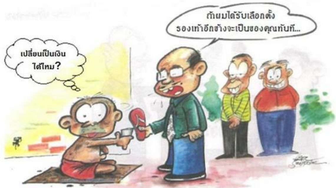
ฝ่าฝืนมีโทษจำคุกตั้งแต่ 1-10 ปี และปรับตั้งแต่ 20,000-200,000 บาท และเพิกถอนสิทธิเลือกตั้ง 10 ปี