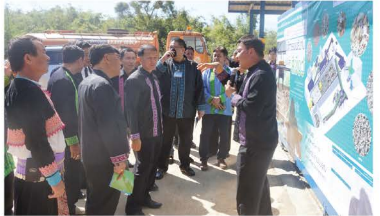
หลังจากนั้นร่วม ตรวจสอบโรงงานผลิตปุ๋ยอินทรีย์ ด้วยเทคโนโลยีการบำบัดขยะโดยวิธีทางกลและชีวภาพของ อบต.เข็กน้อย อำเภอเขาค้อ