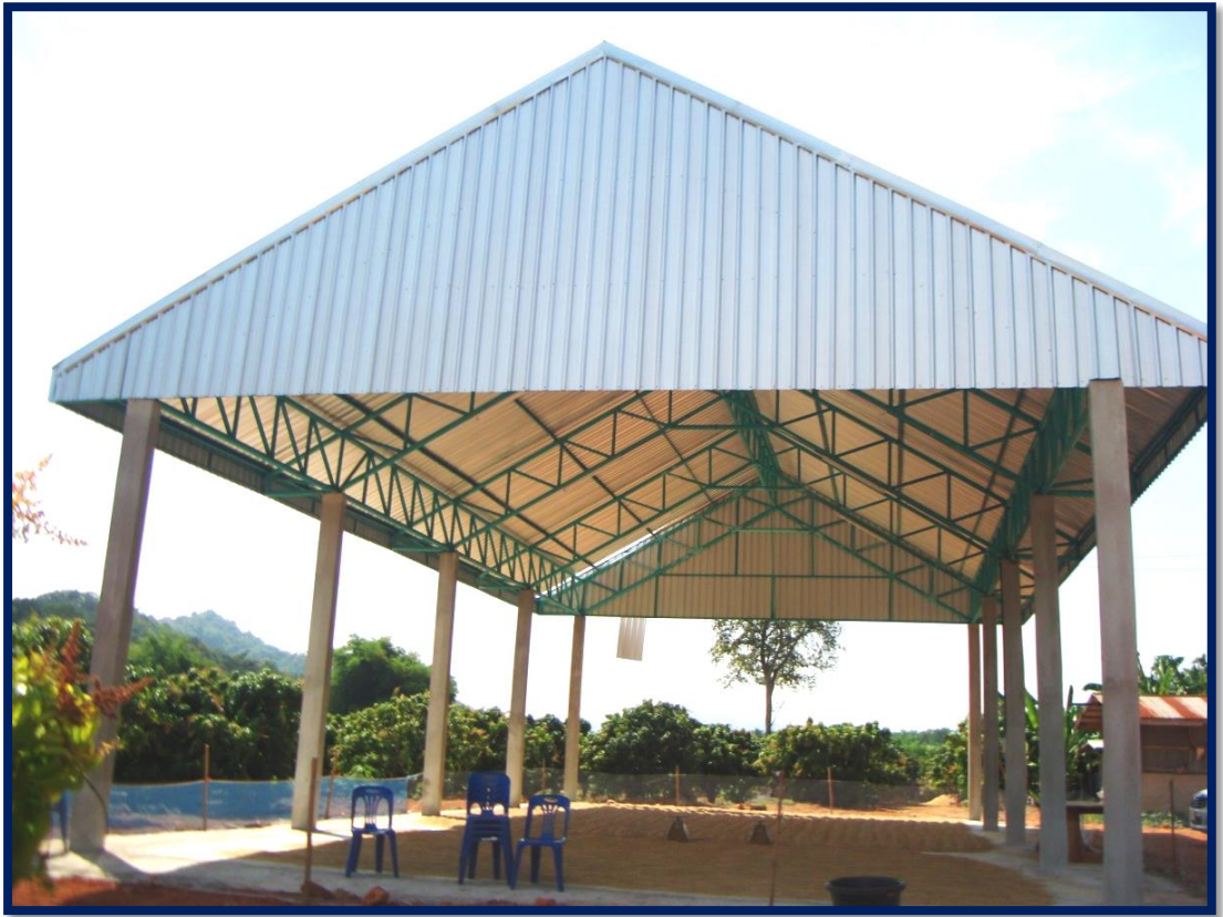
โรงคัดแยกมะม่วง