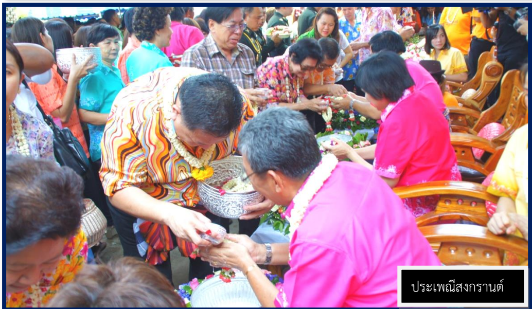
โครงการจัดงานประเพณีของจังหวัดเพชรบูรณ์