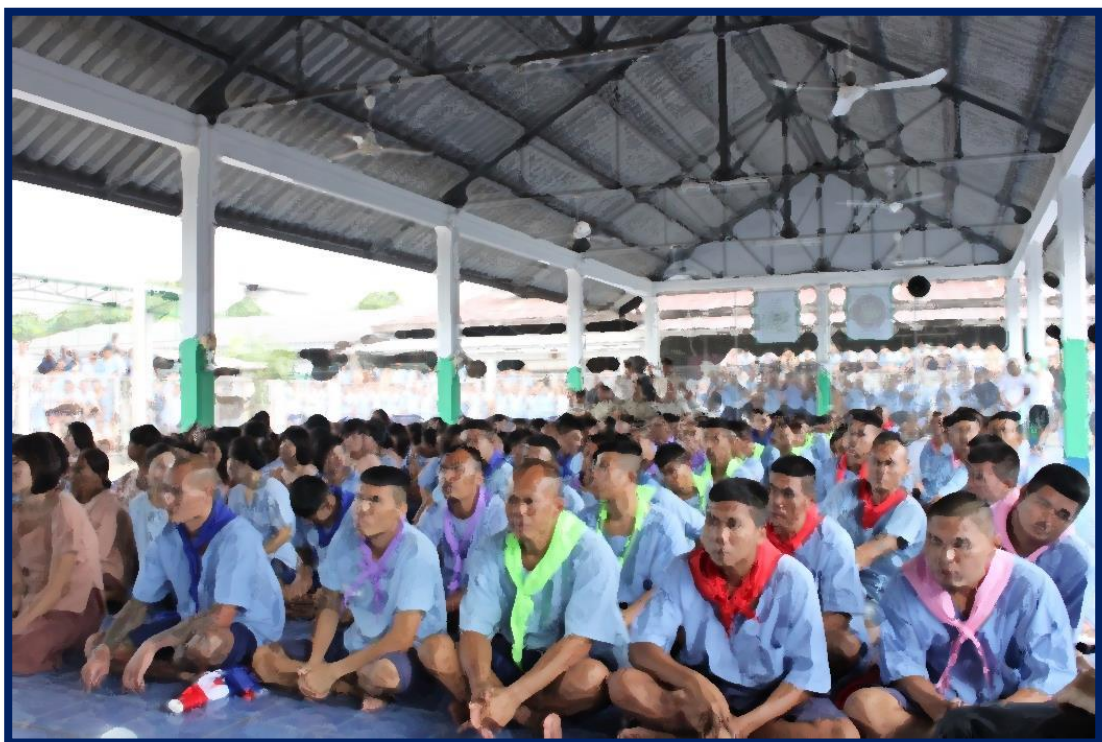
โครงการค่ายฟื้นฟูและปรับเปลี่ยนพฤติกรรมผู้ต้องขังติดยาเสพติด ประจำปี ๒๕๕๖