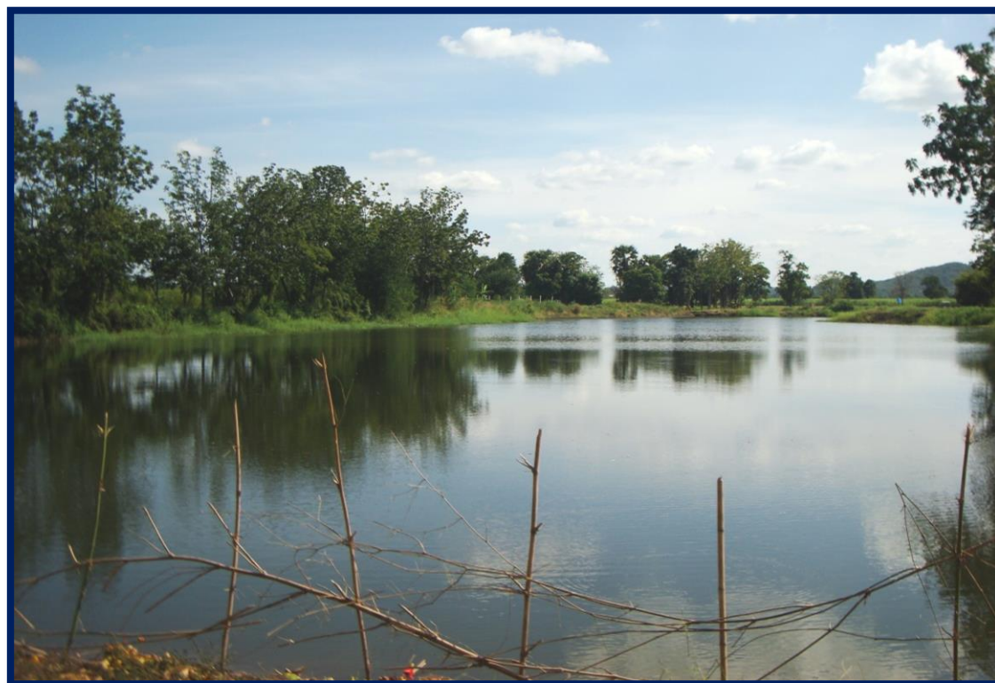
โครงการขุดสระเก็บน้ำบ้านคลองชะอ่อมหมู่ที่ ๑๘ บ้านวังขอนเท็ดพระเกียรติ ตำบลคลองกระจิง อำเภอศรีเทพจังหวัดเพชรบูรณ์