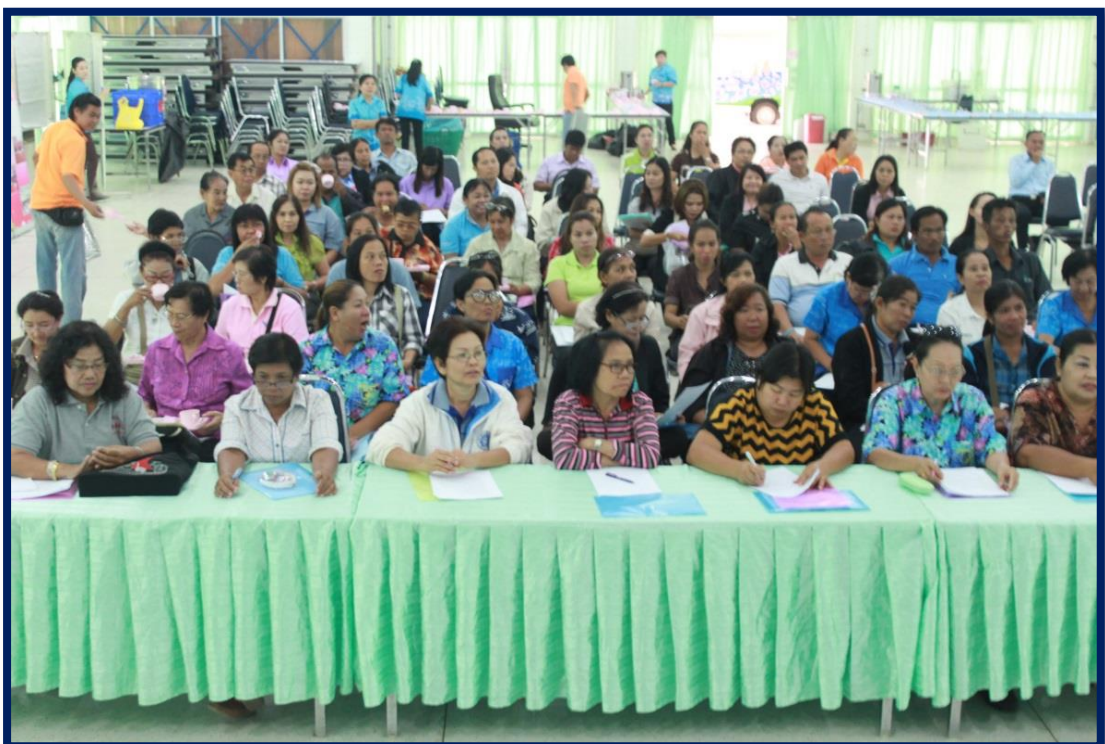
โครงการจัดทำแผนพัฒนาท้องถิ่น