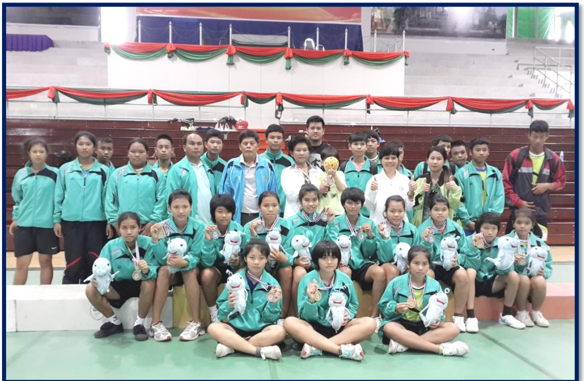
โครงการส่งเสริมกีฬาขององค์การบริหารส่วนจังหวัดกับหน่วยงานอื่น