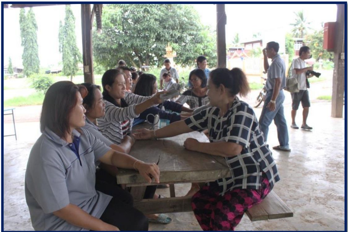
โครงการอาสาสมัครสาธารณสุขประจำหมู่บ้าน (อสม.) สัตยจร