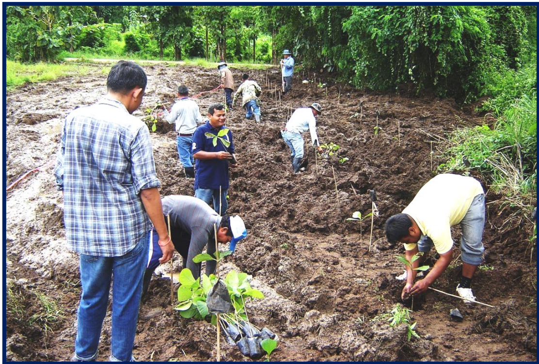
โครงการปลูกต้นไม้ ประจำปี ๒๕๕๖ ณ สำนักงานสาขาขององค์การบริหารส่วนจังหวัดเพชรบูรณ์ สาขาอำเภอวิเชียรบุรี จังหวัดเพชรบูรณ์