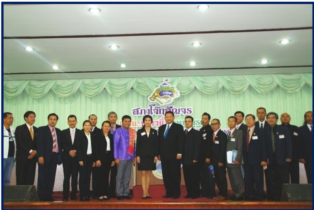
โครงการหนาวนึ่งที่เพชรบูรณ์ในรูปแบบสภาโຈ๊ก