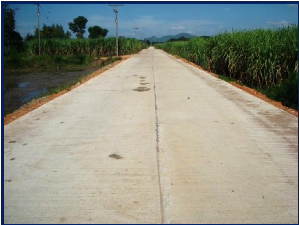
โครงการก่อสร้างถนนคสล. บ้านหนองปลาไหล หมู่ที่ ๖ ตำบลวังใหญ่ อำเภอวิเชียรบุรี จังหวัดเพชรบูรณ์