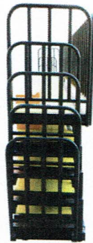
ด้านข้าง(ขนาดพับเก็บ)