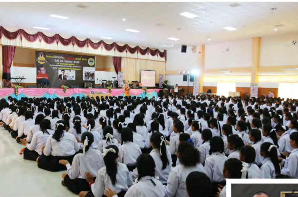
กิจกรรมภายในงาน อาทิเช่น การบรรยายธรรม Talk Show ฯลฯ โดยสอดแทรกให้ความรู้เกี่ยวกับยาเสพติด