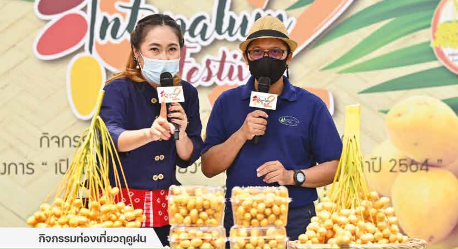
กิจกรรมท่องเที่ยวฤดูฝน