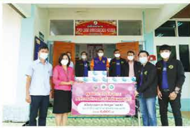
สำนักงานสาธารณสุข อำเภอศรีเทพ จำนวน 1,500 ชุด