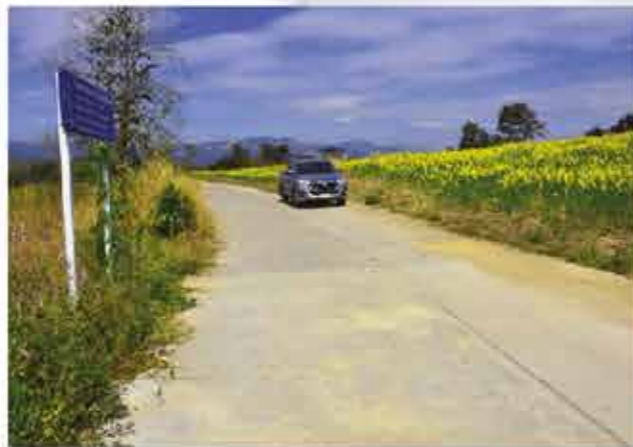
โครงการก่อสร้างถนนคอนกรีตเสริมเหล็ก สายนาข่า-ภูผักไซ หมู่ 6 บ้านนาข่า ตำบลนาข่า อำเภอหล่มเก่า 449,500 บาท