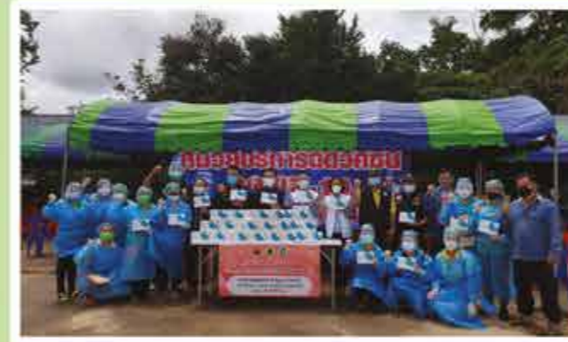
สำนักงานสาธารณสุข อำเภอวังโป่ง จำนวน 1,000 ชุด