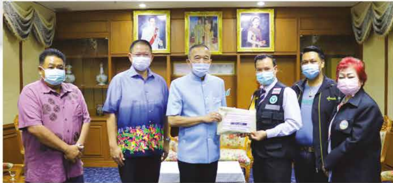
ปลัดองค์การบริหารส่วนจังหวัดเพชรบูรณ์ รับผิดชอบของบริจาคชุด PPE