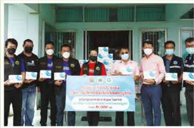
สำนักงานสาธารณสุข อำเภอวิเชียรบุรี จำนวน 1,500 ชุด