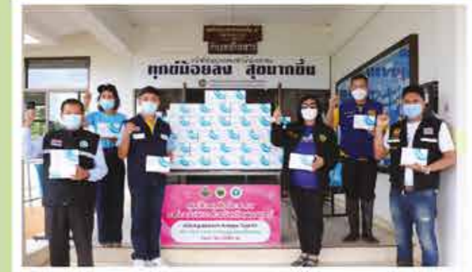
สำนักงานสาธารณสุข อำเภอชนแดน จำนวน 1,000 ชุด