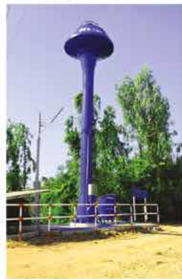
โครงการก่อสร้างระบบประปาหอดึงสูงแมนแมนแปง หมู่ 6 ตำบลกองทุล อำเภอหนองไผ่ 494,500 บาท