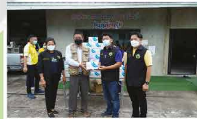
สำนักงานสาธารณสุข อำเภอเขาค้อ จำนวน 1,000 ชุด