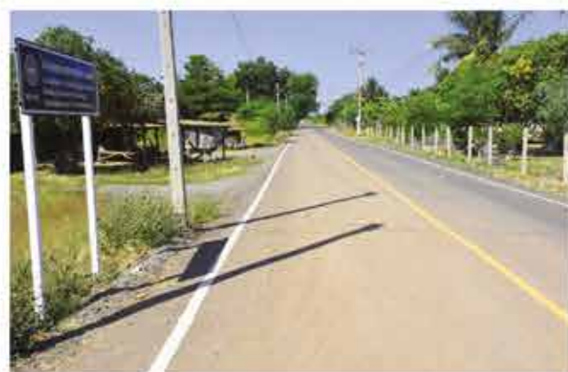
โครงการก่อสร้างถนนลาดยางผิวจราจรเทพีล สายบ้านชุมใหญ่ หมู่ 7 ตำบลวังพิศกุล อำเภอ บึงสามพัน 834,500 บาท