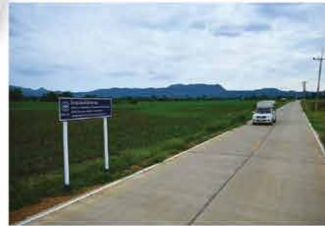
ถนนสายขีบสาริกา - ขีบตะเคียน ตำบลขีบสมอทอด อำเภอบึงสามพัน