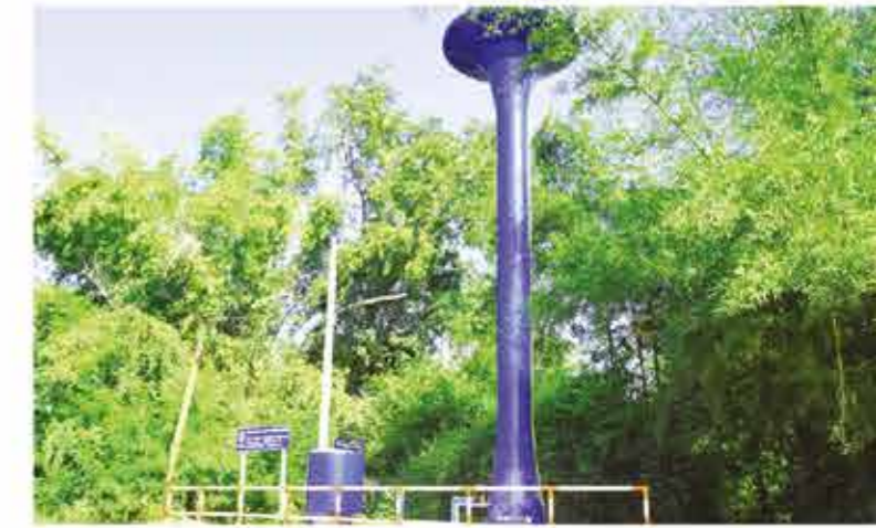
โครงการก่อสร้างระบบประปาหอดึงสูงแบบ แมนแมน หมู่ 7 ตำบลกองทุล อำเภอหนองไผ่ 455,500 บาท