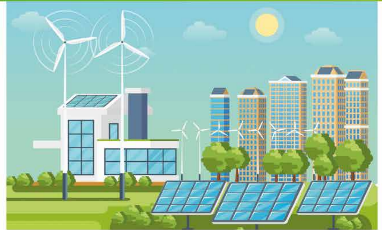
ติดตั้งไฟฟ้าพลังงานแสงอาทิตย์