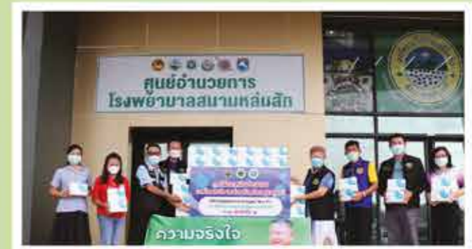
สำนักงานสาธารณสุข อำเภอน้ำหนาว จำนวน 1,000 ชุด