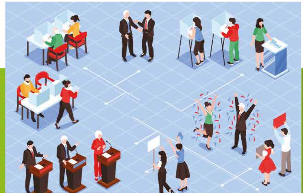
จัดการเลือกตั้งสมาชิกสภา อบจ.เพชรบูรณ์และนายก อบจ.เพชรบูรณ์