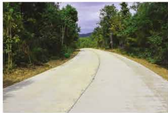
โครงการก่อสร้างถนนคอนกรีตเสริมเหล็ก สายโคกเจริญ หมู่ 2 บ้านแก่งโตน ตำบลนาข่า อำเภอหล่มเก่า 777,000 บาท