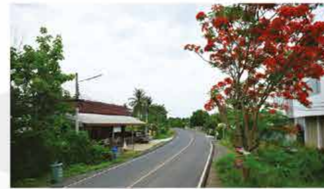
ถนนสาย 2271 - ป่าม่วง ตำบลสะเดียง อำเภอเมือง