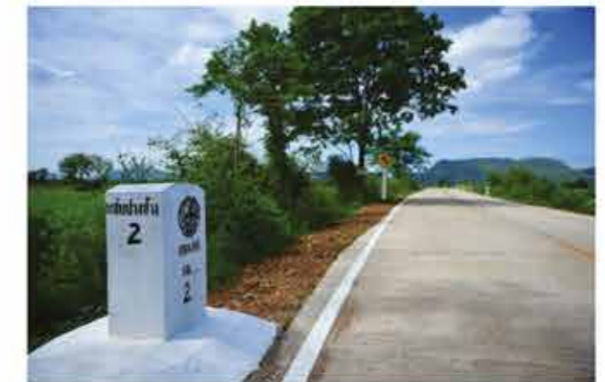
ถนนสายขีบปางช้าง - คลองทราย ตำบลขีบน้อย อำเภอวิเชียรบุรี

“ตนและคนในหมู่บ้านรู้สึกดีใจเป็นอย่างมากที่องค์การบริหารส่วนจังหวัดเพชรบูรณ์มาสร้างถนนให้เป็นอย่างดีและสวยงาม เมื่อก่อนที่เป็นถนนดินลูกรังก็มีแต่หลุมแต่บ่อ ตนเห็นหมู่บ้านอื่นเขาลาดยางกันก็ยิ่งรู้สึกอิจฉาและน้อยใจว่าหมู่บ้านเราทำไมถึงลำบากและกันดารอย่างนี้ ไม่คิดเลยว่าชีวิตนี้จะได้เห็นถนนดี ๆ ในหมู่บ้าน กระทั่งเมื่อไม่นานมานี้ทราบข่าวว่า องค์การบริหารส่วนจังหวัดเพชรบูรณ์จะมาสร้างถนนให้ใหม่ก็รู้สึกดีใจ เฝ้ารอว่าเมื่อไหร่ถนนจะเสร็จ กระทั่งปัจจุบันเสร็จเรียบร้อยและมีความสวยงาม ตนก็ยังนึกเสียดายเพื่อนรุ่นราวคราวเดียวกันที่เสียชีวิตไปแล้ว ไม่มีโอกาสได้เห็นความเจริญของหมู่บ้านเรา จากนั้นตนก็คงนอนตายตาหลับแล้ว ต้องขอขอบคุณองค์การบริหารส่วนจังหวัดเพชรบูรณ์ที่มาสร้างถนนและนำความเจริญมาให้ชาวบ้านหมู่บ้านแห่งนี้”