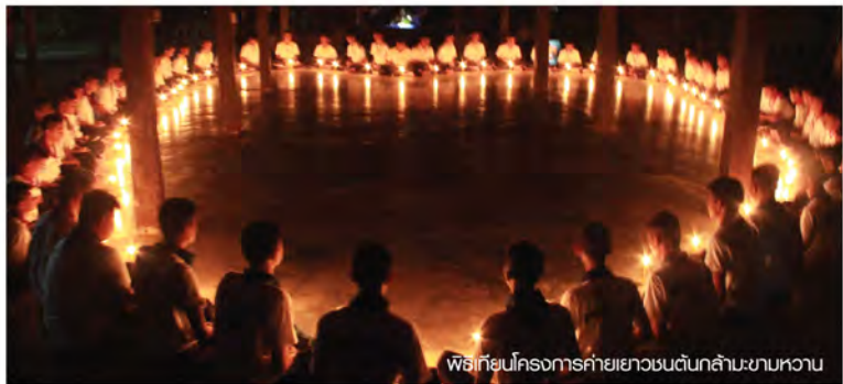
พิธีเทียนโครงการค่ายเยาวชนต้นกล้ามะขามหวาน